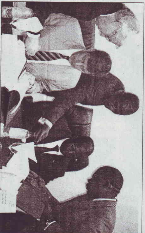
Après la signature de l'accord d'étape, chaque partie doit respecter ses engagements.

Ce que gagne le Cameroun Mais, ce que gagne le Cameroun de l'accord intérimaire est ce que précoc-